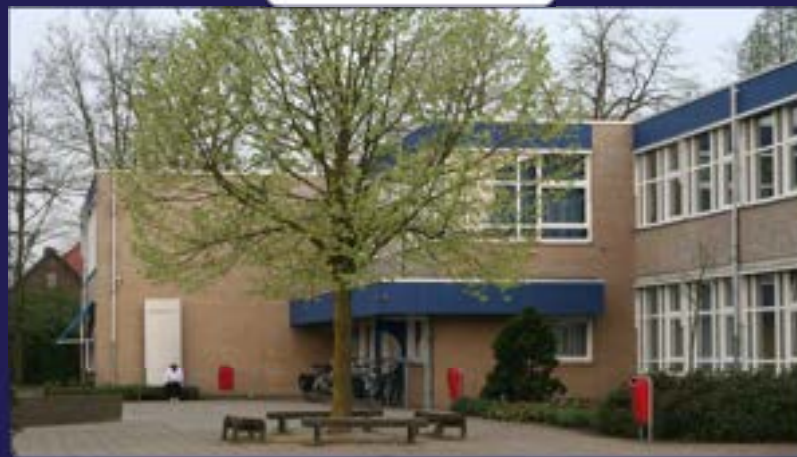
Borculo Beukenlaan – vmbo, mavo, havo, vwo