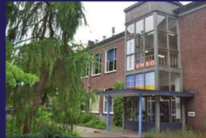
Borculo Herenlaan – vmbo leerjaar 3 en 4