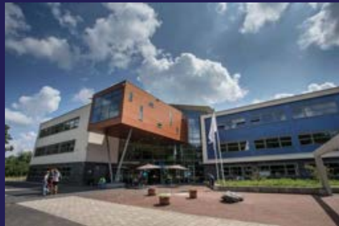
Lochem – vmbo, mavo, havo, vwo